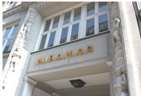
Miramarhaus, Schopenstehl 15, Hamburg